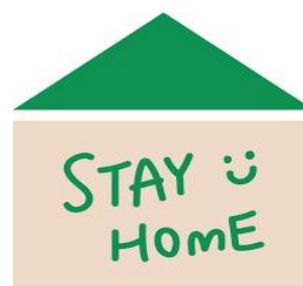
【不要不急の外出を避ける】

学校が再開し、また会うために、今、皆さんができる限りの行動をしよう。 あなた自身が、大切な人が、この状況を切り抜け、また会えるように。