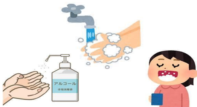
【手洗い・うがい・消毒の徹底】